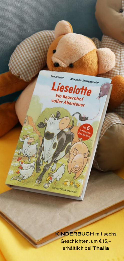
KINDERBUCH mit sechs Geschichten, um €15,- erhältlich bei Thalia

Spiel und Spaß für die Kleinsten – zu Ostern oder auch einfach so.