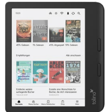
TOLINO Vision Color eReader, um €199,- erhältlich bei Thalia

Ob es darum geht, auf einfache Weise in Verbindung zu bleiben, Wege flott zurückzulegen oder platzsparend ganze Bibliotheken in die Tasche zu stecken: In den Shops des HEY! ist man auf dem neuesten Stand der Technik.