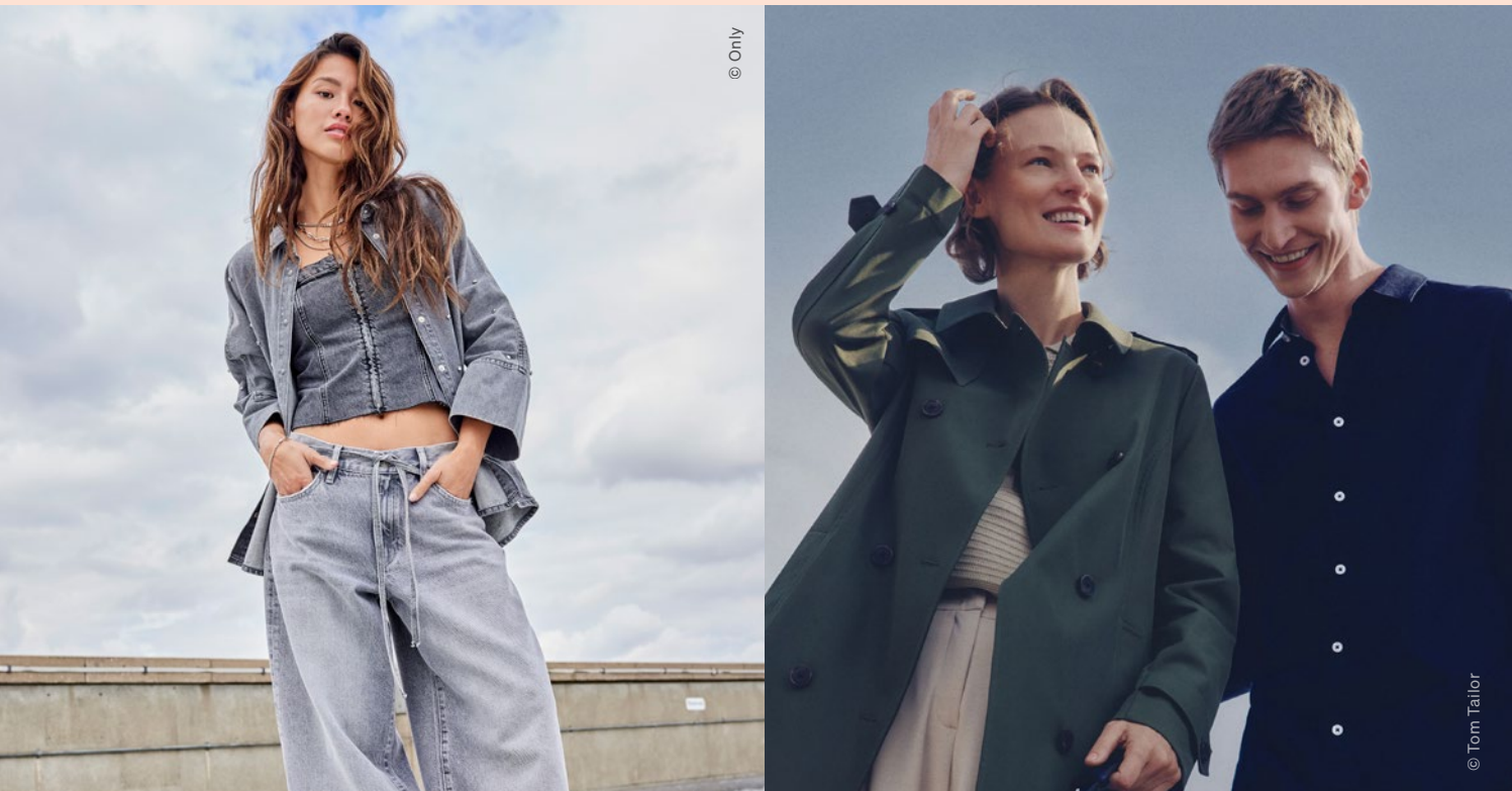
JEANS um €49,99 erhältlich bei Only / TRENCHCOAT für sie, um €119,99 HEMD für ihn, mit Kentkragen, um €39,99 erhältlich bei Tom Tailor

Diesen MODEFRÜHLING gehen wir es ganz schön LOCKER an.