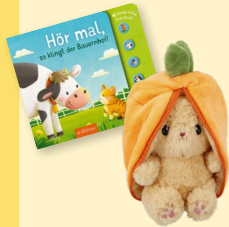
KINDERBUCH mit Sounds, um €16,- erhältlich bei Thalia STOFFTIER mit Reißverschluss, 12 cm, um €12,95 erhältlich bei Nanu-Nana

Spiel und Spaß für die Kleinsten – zu Ostern oder auch einfach so.