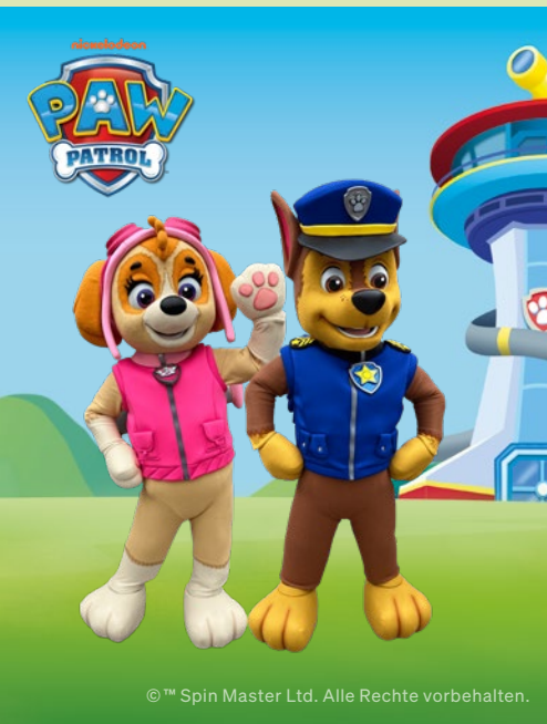
©™ Spin Master Ltd. Alle Rechte vorbehalten.

Am 4. Juli holen sich Schüler*innen nicht nur ihre Zeugnisse ab, sondern von 10-13 Uhr auch ein sommerliches Geschenk von uns im HEY! Wir verteilen nämlich gratis Glitzerwasserbälle, damit du im Sommer richtig viel Spaß hast. Solange der Vorrat reicht.