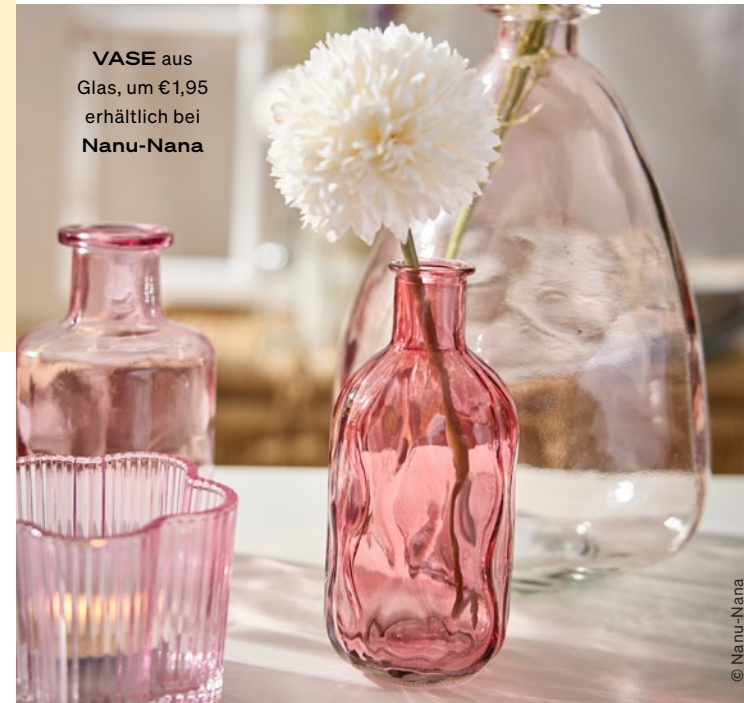
VASE aus Glas, um €1,95 erhältlich bei Nanu-Nana