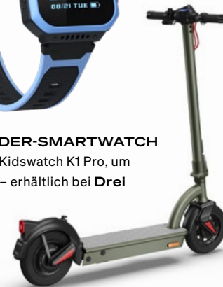
E-SCOOTER von KT4, ab €560,- oder um €25,- mit A1 Teilzahlung für 24 Monate und €100,- Anzahlung erhältlich bei A1

Ob es darum geht, auf einfache Weise in Verbindung zu bleiben, Wege flott zurückzulegen oder platzsparend ganze Bibliotheken in die Tasche zu stecken: In den Shops des HEY! ist man auf dem neuesten Stand der Technik.