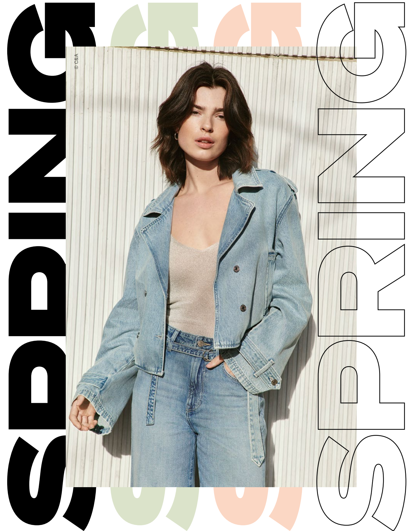
JACKE mit weiten Ärmeln, um €49,99 erhältlich bei C&A JEANS Loose Fit, um €35,99 erhältlich bei C&A

Stoffhosen in neutralen Farben wie Beige oder Creme, kombiniert mit figurnahen Blusen in Kontrastfarben, sehr elegant. Darüber machen sich weit geschnittene Blazer oder Trenchcoats hervorragend. Zu locker-legeren Denim-Teilen wird dann in der Freizeit gegriffen. Ein schimmerndes Top dazu, und fertig ist ein heißer Look, der sich ganz wunderbar bequem trägt. In den Shops des HEY! findest du diesen und noch viele weitere Trends der Saison.