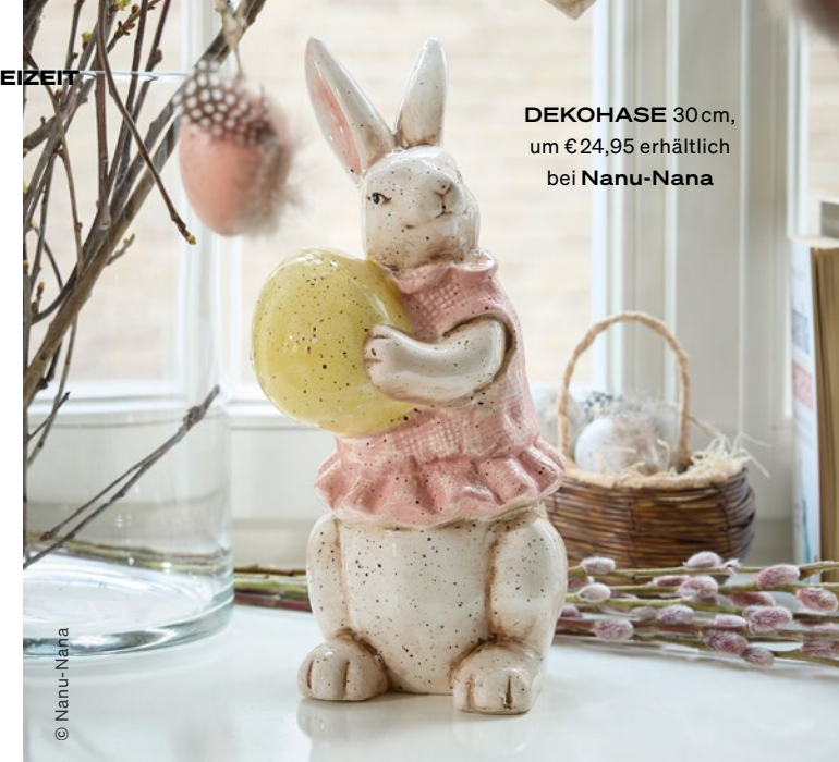
DEKOHASE 30 cm, um €24,95 erhältlich bei Nanu-Nana

Zarte Pastelltöne machen heuer das Osterfest zum Hingucker. Lass dich in unseren Shops inspirieren!