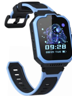
KINDER-SMARTWATCH ZTE Kidswatch K1 Pro, um €29,- erhältlich bei Drei

HIGHLIGHTS aus der Welt der TECHNIK gibt's im HEY! NOCH VIELE MEHR!