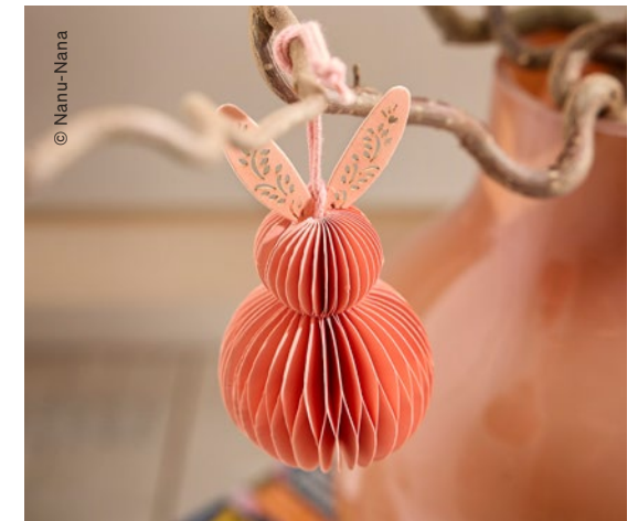
ANHÄNGER aus Papier, 10 cm, um €3,95 erhältlich bei Nanu-Nana